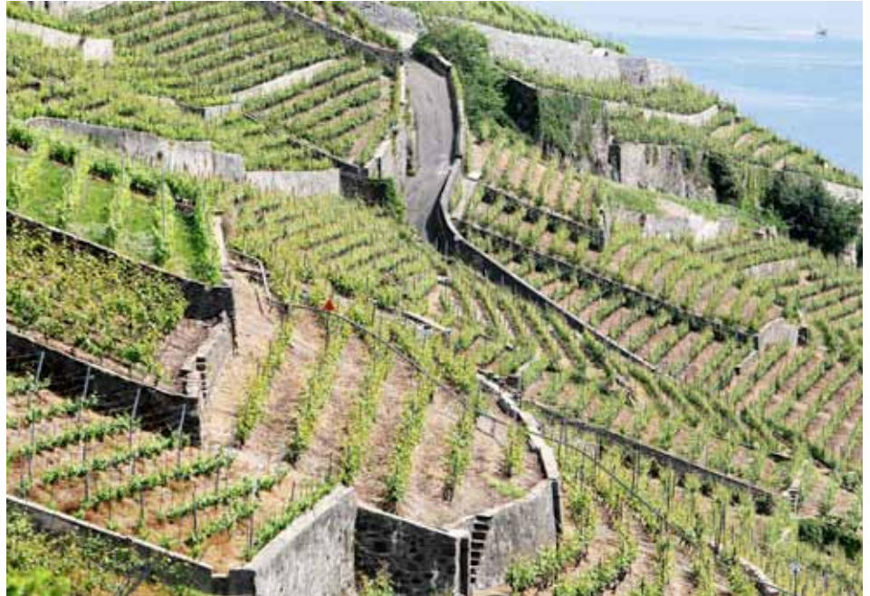
Die Erbschaftssteuer erschwere die familieninterne Nachfolgeplanung von KMU's, lautet etwa eine Kritik. Die Forschung hat dazu keine Evidenz gefunden. In den Weinbergen von Lavaux ist das Familieneigentum sehr wichtig.

Wie wird die Erbschaftssteuer in der wissenschaftlichen Literatur beurteilt? Welches sind die massgebenden Aspekte gemäss der Wirtschaftstheorie, und welche Ergebnisse der empirischen Forschung liegen zu diesem Bereich vor? Im Zentrum der wirtschaftlichen Betrachtungsweise stehen zwei Konzepte: zum einen die Gerechtigkeit als normatives Kriterium bezüglich der Verteilung des Wohlstands und zum anderen die Effizienz, d. h. das Bestreben, negative Auswirkungen der Erbschaftssteuer auf individuelle Entscheide auf ein Mindestmass zu begrenzen. Da die Gerechtigkeit ein sehr subjektiver Begriff ist, konzentriert sich die wissenschaftliche Literatur weitgehend auf den Aspekt der Effizienz. Dabei geht es um die Frage, welche Auswirkungen die Erbschaftssteuer auf die Entscheide der Individuen in verschiedenen Bereichen hat: Sparanstrengungen, Arbeitsbereitschaft, Mobilität, Steuerumgehung usw. Die theoretischen Modelle bieten eine strukturierte Analyse dieser verschiedenen Mechanismen, während es bei den empirischen Analysen darum geht, die Intensität dieser Mechanismen zu erheben.